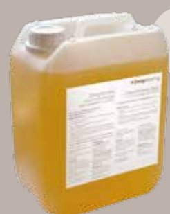
Designflooring Clean 5 litrit 1250m 2

Tähistage kogu puhastamisprotsessi ajaks puhastatav ala kindlasti märja põrandasiltidega.