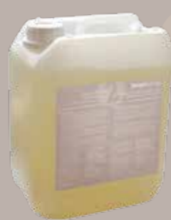
Designflooring Remove 5 litrit 250m 2