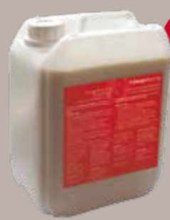
Designflooring Refresh 5 litrit 90m 2