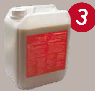
Designflooring Refresh 5 liitrit 90m 2